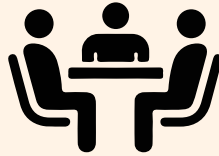
Tableau du Conseil Municipal :

332 voix soit 49.33 % des suffrages exprimés • 3 sièges au conseil municipal